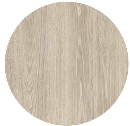
Eiche „Limed Grey“