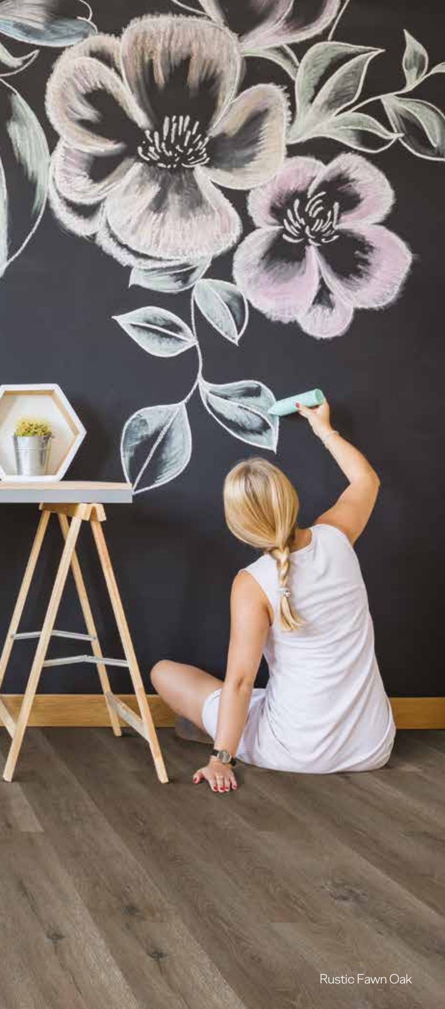
Rustic Fawn Oak