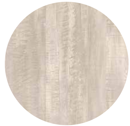
Eiche „Claw Silver“