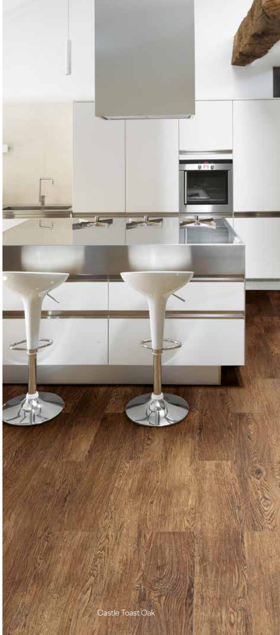
Castle Toast Oak